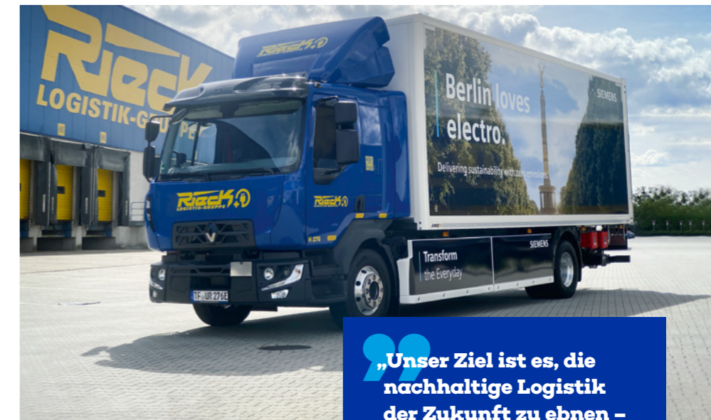
Täglich ist unser eTruck für Siemens im Berliner Stadtverkehr unterwegs.

Die ersten Wochen zeigen jetzt die Leistungsfähigkeit im Praxisbetrieb – so haben Witterung und Temperatur Auswirkungen auf den Stromverbrauch und übermäßige Staus oder Umleitungen auf die benötigte Reichweite. „Wir haben Anlaufschwierigkeiten einkalkuliert und dafür einen Plan B in der Tasche“, sagt Benjamin Manzer, Fuhrparkleiter bei Rieck. „Aber bisher läuft alles wie erhofft.“